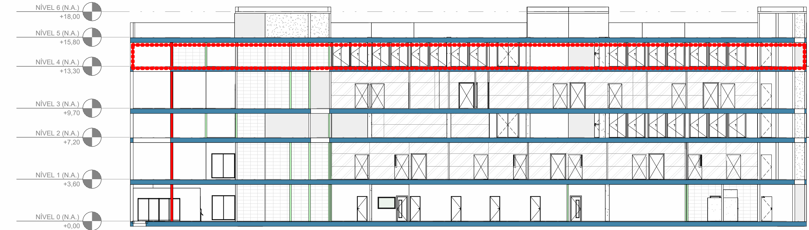
2 CORTE - LOCALIZAÇÃO NO PAVIMENTO - N4 ESCALA 1:200